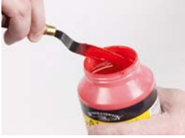
Galeria pot met brede opening en rechte zijkanten

Potten met rechttere zijkanten: de zijkant van de pot is nu rechter zodat de verf niet meer onbereikbaar onder de rand blijft zitten. In combinatie met de bredere opening zorgt dit dat u in de hele pot gemakkelijker met uw penseel of paletmes bij de verf komt.