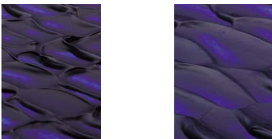
In Galeria blijft de streek van het paletmes staan In een ander merk acrylverf vlakkt hij uit

Sommige andere merken acrylverf komen dikvloeibaar uit de pot of tube, maar vlakken op het canvas uit.