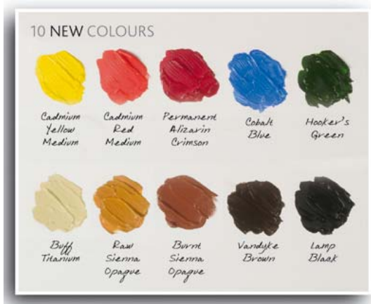
De 10 nieuwe Galeria kleuren

Het assortiment is bovendien uitgebreid met 10 NIEUWE kleuren, wat het totaal op 60 brengt. Met deze kleuren erbij biedt Galeria een nog bredere keuze voor uw palet.