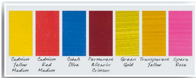
Artists' pigmenten in Galeria.

Winsor & Newton is de eerste die voordelige acrylverf maakt met pigmenten met een kwaliteitsniveau dat gewoonlijk alleen wordt gebruikt voor verf van artists' kwaliteit. Het gaat om Cadmium Yellow Medium, Cadmium Red Medium, Cobalt Blue, Permanent Alizarin Crimson, Green Gold, Transparant Yellow & Opera Rose. Het voordelige assortiment Galeria biedt daardoor over de hele breedte van het spectrum meer keus.