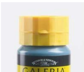
Platte dop Galeria

Stapelbare klikdop: de bovenkant van de dop is plat zodat u de potten in het atelier kunt opstapelen om de ruimte efficiënter te benutten. Dat is bovendien voordeliger omdat u de potten, als ze bijna leeg zijn, op de dop kunt zetten, zodat de laatste verf naar de dop zakt.